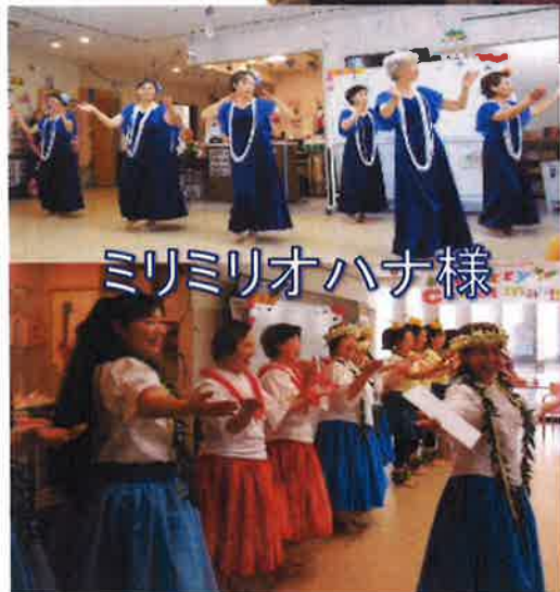
ミリミリオハナ様