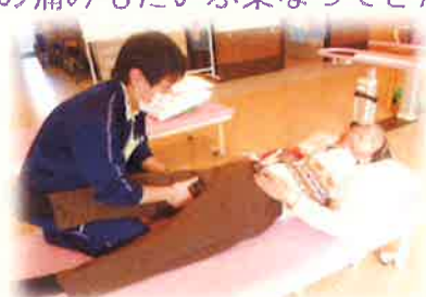
これやったら一人で