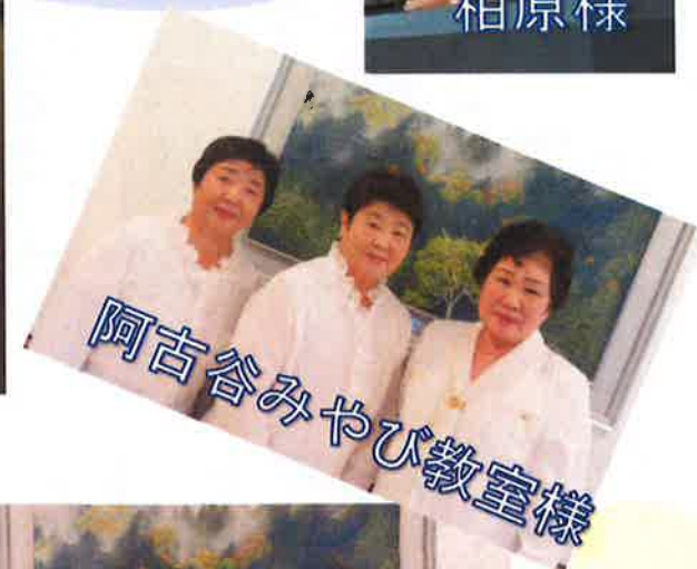
阿古谷みやび教室様