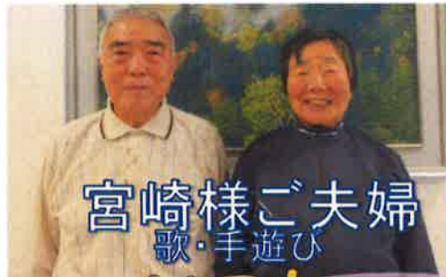
宮崎様ご夫婦 歌・手遊び