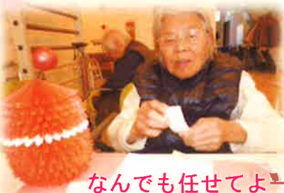
なんでも任せてよーっ!!