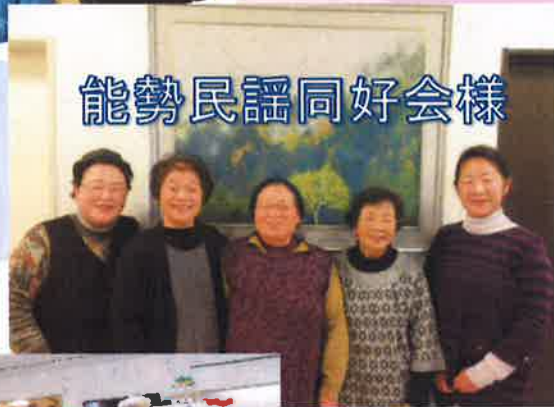
能勢民謡同好会様