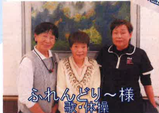
ふれんどり~様 歌・体操