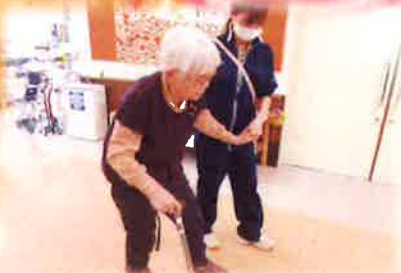
昔は杖で歩けとったん