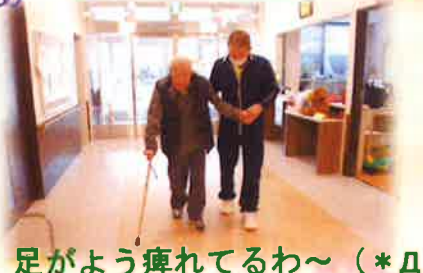
足がよう痺れてるわ〜(*Д*)